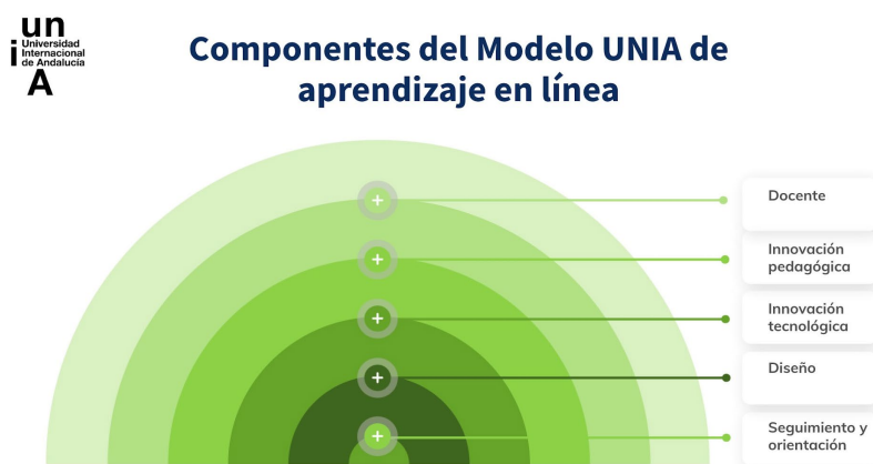
Figura 1. Componentes del Modelo UNIA de aprendizaje en línea ( el/A )

El diseño metodológico de las asignaturas obligatorias de este Máster se sitúa dentro del Modelo UNIA de aprendizaje en línea ( el/A ). Este modelo permite ofrecer a los estudiantes una experiencia de aprendizaje valiosa y vinculada con sus necesidades. Se articula en cinco ejes o pilares básicos (véase la Figura 1).