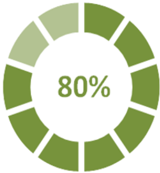
CONTRIBUCIÓN A SU INSERCIÓN LABORAL